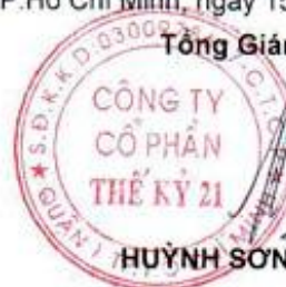
HUYỀN SƠN PHƯỚC